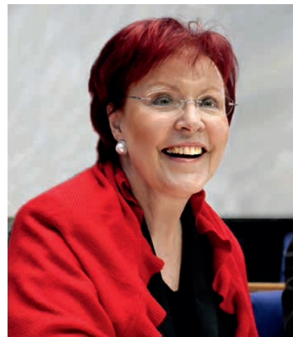
Heidemarie Wieczorek-Zeul, SPD, Bundesministerin a.D.: Gerechtigkeit ist auch in der Bildung wichtig.

Und dann, ganz Politikerin, schiebt sie noch nach: »Ein Land, das seine Ressourcen in den Köpfen der Menschen sieht, sollte dafür die Mittel bereitstellen und in Bildung, Wissenschaft und Forschung