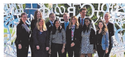
Vereinte Nationen: Frankfurter Studierende bei UN in New York