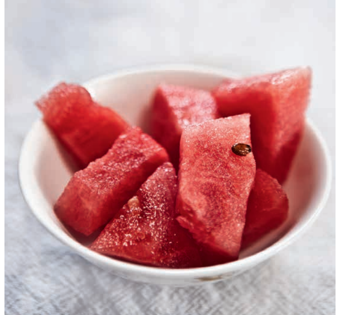
Fleischesser oder Vegetarier: Aus Ernährung ist ein Lebensstil geworden.