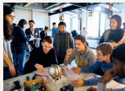
Schüler der 12. Klasse, Schule am Ried