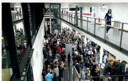
Night of Science

sischen Hochschulpreis für Exzellenz in der Lehre ausgezeichnet. Der Eintritt ist frei. Auch während der Night of Science findet eine Alumni-Lounge statt, zu der alle Alumni herzlich eingeladen sind. Infos und Anmeldung unter: www.alumni.uni-frankfurt.de ■