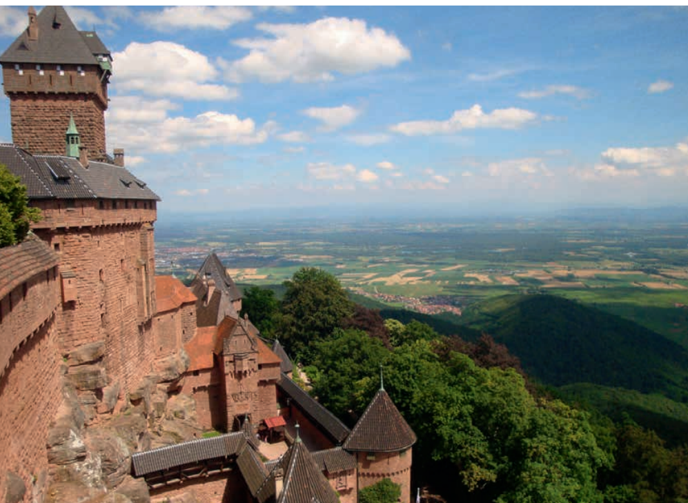
Blick von der Hochkönigsburg in das Oberrheintal; Exkursion »Durch das Elsass« 2016

Der Besuch eines der hochklassigen Vorträge ist für Bachelor-Studierende mittlerweile sogar Pflicht. Es gibt Punkte dafür. Alle Vorträge sind beim Hessischen Institut für Qualitätsentwicklung (IQ) als Lehrerfortbildung akkreditiert. Auch so lassen sich künftige Mitglieder ansprechen. Die Geografische Gesellschaft macht das mit Erfolg. (hju) ■