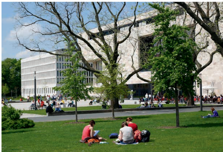
Damit Studieren gelingt – Studentenwerk unterstützt umstandslos.

In Frankfurt zu studieren ist teuer. Bafög, Bildungskredit, KfW-Studienkredit, Stipendien – im Beratungszentrum des Studentenwerks können sich Studierende informieren, wie sie ihr Studium finanzieren können. Doch manchmal braucht es direkte Hilfe. Sofort. So wie bei M., die vier Monate des laufenden Semesters studier- und arbeitsunfähig erkrankt ist. Ihre Ersparnisse braucht sie in dieser Zeit auf. Sie benötigt dringend Geld, um den Semesterbeitrag zu entrichten, damit sie nach überstandener Krankheit weiter studieren kann. Zu